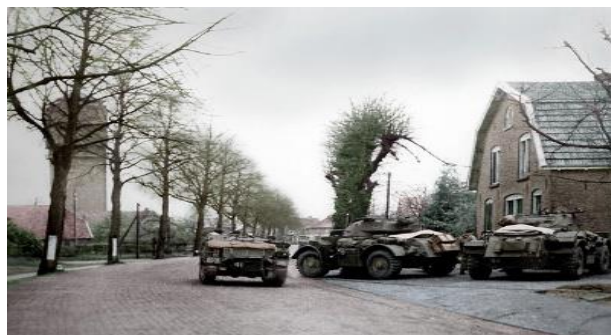
Canadese verkennersseenheid aan de Terborgseweg, 1 april 1945

Op zondag 1 april 1945, het is Eerste Paasdag, bereiken Canadese troepen via de Terborgseweg Doetinchem. Ze worden aan de oostelijke stadsrand opgewacht door mensen van het verzet. Na een kort overleg rukken de Canadezen op naar het centrum, terwijl een grote troepenmacht om de stad trekt.