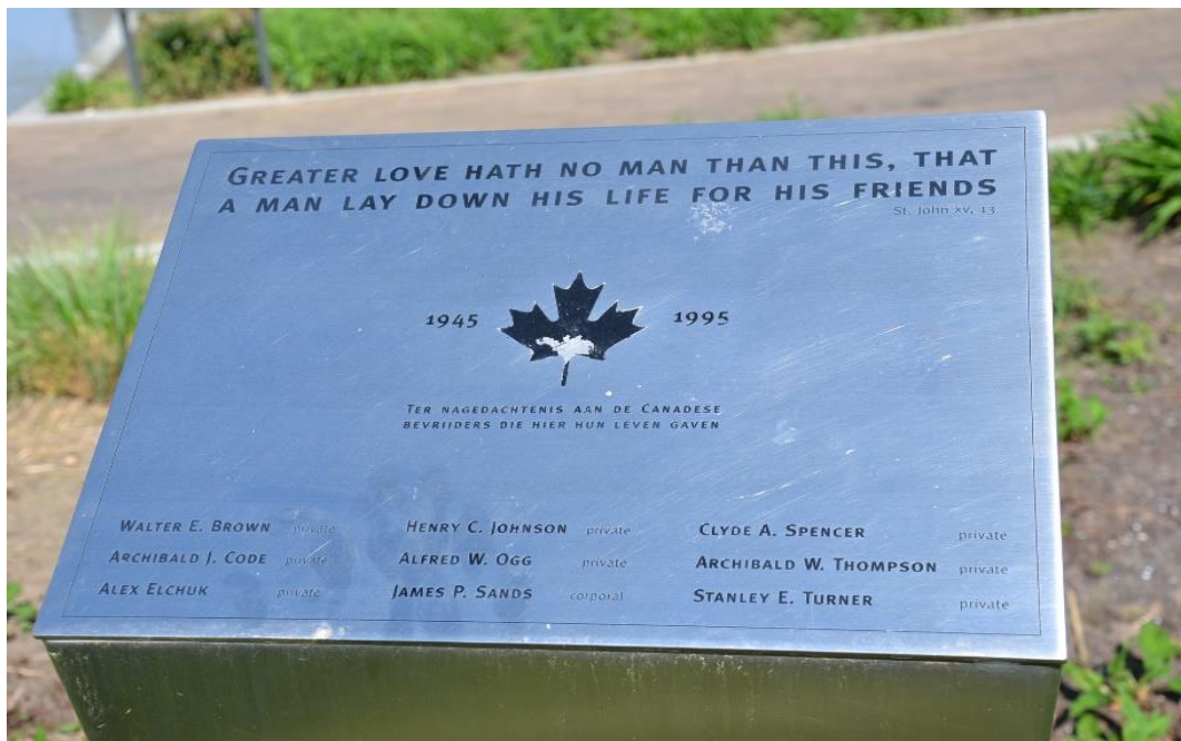
Monument in Doetinchem in het Mark Tennantplantsoen